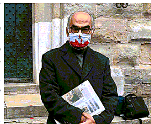
Luciano Bacchetta Sindaco di Città di Castello

me "ora più che mai occorre tenere sempre la guardia alta ed osservare tutte le disposizioni sanitarie e di stanziamento sociale in particolare in questo periodo che precede le festività natalizie". Luciano Bacchetta ha quindi sottolineato il contenuto di una comunicazione dell'Usl Umbria 1 che riguarda "l'attivazione delle prenotazioni automatiche attraverso i medici di famiglia, per fare in modo che i tamponi possano essere eseguiti nei tempi più brevi possibili nei casi in cui le persone ne abbiano necessità".