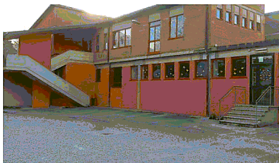
La primaria di Pierantonio. Un metodo di scuola alternativo quello che verrà presentato sabato