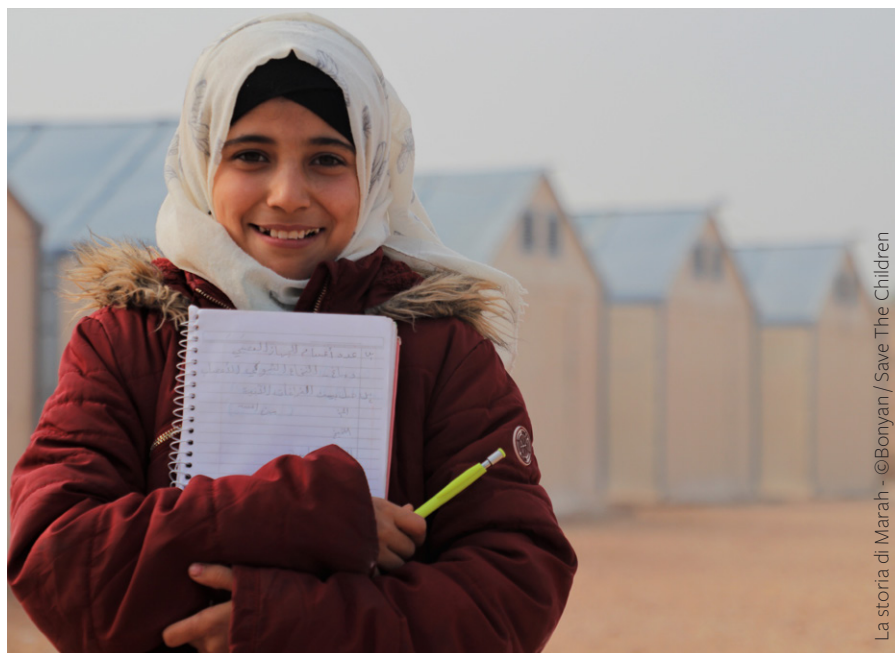
La storia di Marah

Per il resto, rimando alla lettura della rivista, che — spero — continuerà a essere uno strumento prezioso per la riflessione e la crescita culturale e professionale, non solo per le scuole che aderiscono al movimento, ma anche per tutti coloro che condividono la sua visione. Speriamo che la rivista continui a ispirare e stimolare la discussione, offrendo spunti e idee che possano arricchire il panorama educativo italiano e oltre. Con questa apertura al dialogo e alla condivisione, Senza Zaino si conferma come una comunità dinamica e inclusiva, pronta a collaborare con tutte le realtà interessate a promuovere un'istruzione di qualità e, nel nostro piccolo, a creare un futuro migliore per le generazioni future.